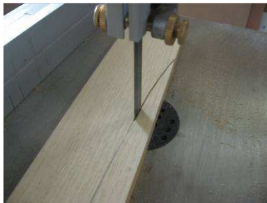
Découpe des cadres

Ils sont débités dans des sections de 80 x 12 mm. Les arrondis inférieurs sont réalisés à la scie à ruban, le premier morceau de chaque côté sert de gabarit pour tracer les autres, et je me suis servi d'un réglet souple pour tracer les premiers. Le début et la fin du traçage commencent à l'arête de chaque pied.