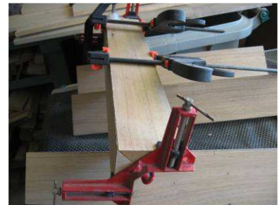
Collage d'un pied

Les cadres sont assemblés par collage et vissage sur les pieds (8 vis suffisent pour un cadre complet, elles servent à renforcer, mais aussi facilitent la mise en place et le collage).