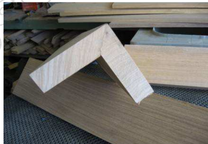
Vue en bout d'un pied