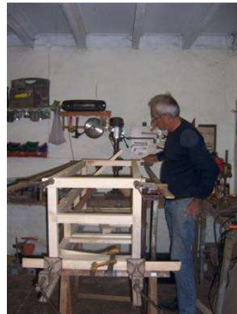
Assemblage suite : Attention, il vaut mieux être deux pour cette phase.