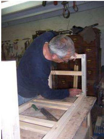
Début de l'assemblage de l'objet.