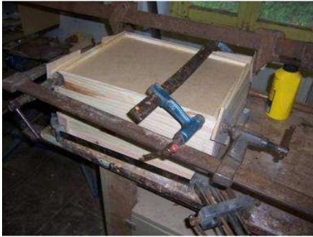
Collage du tiroir.

Et oui, il faut poncer... Ne faites pas comme moi : j'ai oublié de mettre le filtre à poussières.