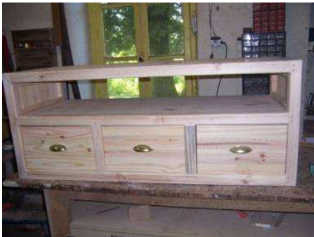
Pose des poignées.

Meuble en cours de finition dans l'atelier. J'ai utilisé un vernis teinté type « aquaréthane ».