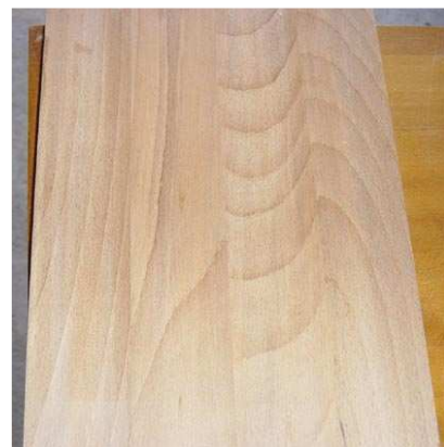
Panneau composé de 4 planches de 55x15x300

Temps total : 1h15. (Les découpes des tôles sont faites à la disceuse !)