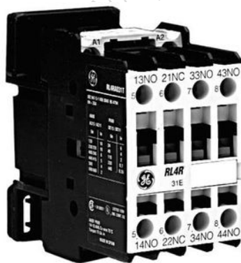
General Electric GEP113006

Enfin, pour le raccordement, chaque borne est repérée 21, 22, 23, 24, 31, 32, 33, 34, 41, 42... etc. (voir sur les photos).