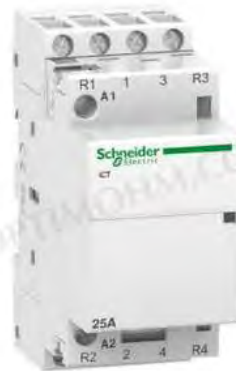
Schneider ICT 25A